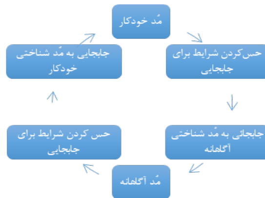
شکل ۱. فرایند جابه‌جایی شناختی

کنترل شده، عقلانی و تجربی، تحلیل و کل‌گرایانه (Holistic)، سیستم C و X، واکنشی (Reflective) و بازتابی (Reflexive) و سیستم ۱ و سیستم ۲ (۵، ۶). عادت یا بازشناخت، یک نوع پردازش اطلاعات خودکار ولی هدفمند یا هدف-وابسته است. در روان‌شناسی شناختی و شناخت اجتماعی، عادت به عنوان یک فرایند مهم در حافظه روندی است که بدون نیاز به کنترل کارکردهای اجرایی به صورت خودکار فعال می‌شود (۷) و در مقایسه با شناخت، نقش تعیین‌کننده‌ای در رفتارهای اجتماعی ایفا می‌کند (۸). به عبارت دیگر، عادت‌ها رفتارهایی هستند که به صورت متناوب در شرایط یکسان تکرار می‌شوند و در زمینه‌های متعدد اقتصادی و اجتماعی به کار گرفته می‌شوند (۹). مطالعات متعدد نشان می‌دهند که مواردی همچون تصمیم‌گیری در شرایط سخت، تصمیم‌گیری در شرایط خوب تعریف نشدن مساله، تصمیم‌گیری‌های روزانه و تصمیم‌های اجتماعی، فرایندهای شناختی خودکار از کارآمدی مطلوبی برخوردار هستند (۴، ۶، ۷). William James عادت را بخش بزرگی از زندگی انسان‌ها می‌داند (۱۰). او رابطه بین عادت و تفکر را این‌گونه تعریف می‌کند که تفکر رسوخی/افاصله‌ای بین عادت‌ها است، به طوری که انسان‌ها دائماً در حال جابه‌جایی شناختی بین تفکر و عادت