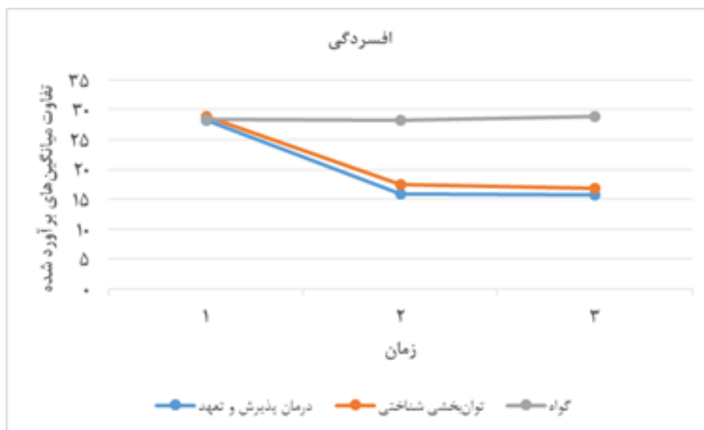
شکل ۲. تغییرات متغیر افسردگی در مراحل پیش‌آزمون، پس‌آزمون و پیگیری در سه گروه پژوهش

گروه اول: درمان پذیرش و تعهد گروه دوم: توان‌بخشی شناختی حافظه فعال گروه سوم: گواه