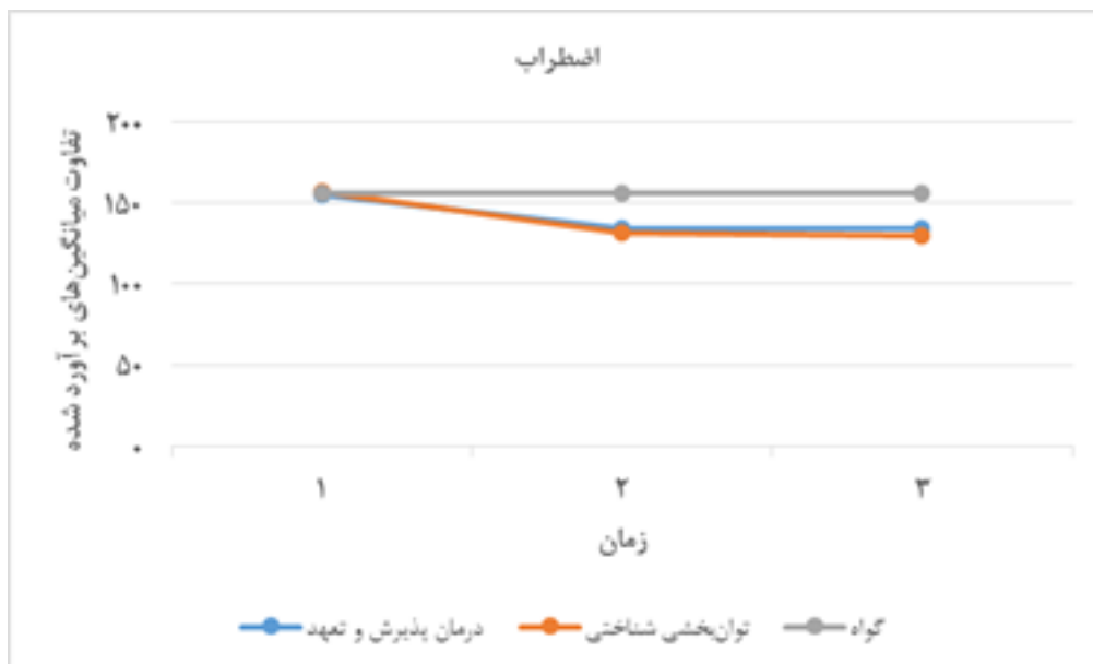
شکل ۱. تغییرات متغیر اضطراب در مراحل پیش‌آزمون، پس‌آزمون و پیگیری در سه گروه پژوهش

گروه اول: درمان پذیرش و تعهد گروه دوم: توان‌بخشی شناختی حافظه فعال گروه سوم: گواه