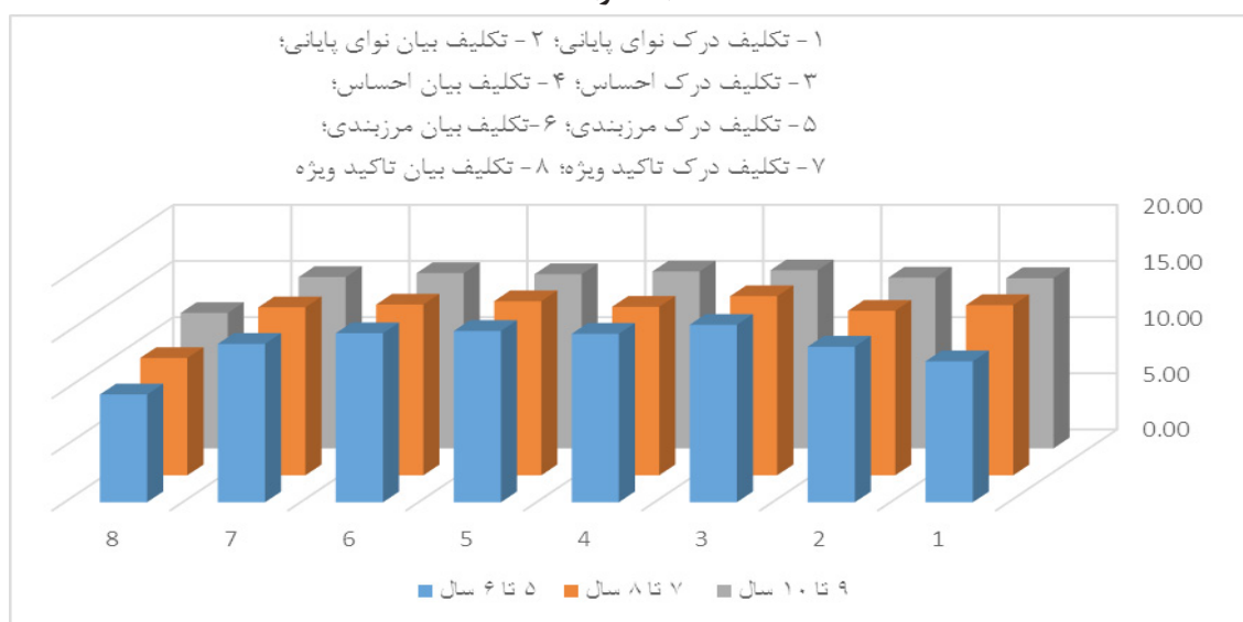
نمودار ۱- میانگین امتیاز تکالیف درک و بیان کاربردهای نوای گفتار در کودکان بهنجار فارسی‌زبان به تفکیک گروه‌های سنی (۶۰ نفر)