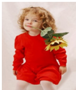
تصویر ۲. بررسی پاسخ عبارت استعاری