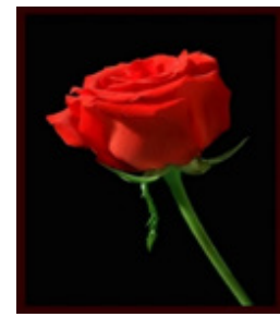
تصویر ۱. پرسیدن سوال وجه شبه

۴۰ روز) از اجرای برنامه داستان خوانی مشارکتی، از آزمون ویلکاکسون استفاده شده است. از تحلیل کوواریانس اندازه‌گیری‌ها به منظور بررسی