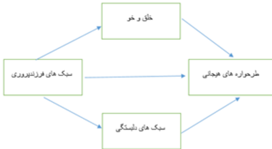
شکل ۱. مدل فرضی پژوهشی برگرفته از مطالعات پیشین

نقش واسطه‌ای را در ارتباط با طرحواره‌های ناسازگار با سبک‌های فرزندپروری دانشجویان داشته باشد؟ همچنین فرضیه‌های این پژوهش عبارتند از: فرضیه اول: سبک‌های فرزندپروری بر طرحواره‌های ناسازگار