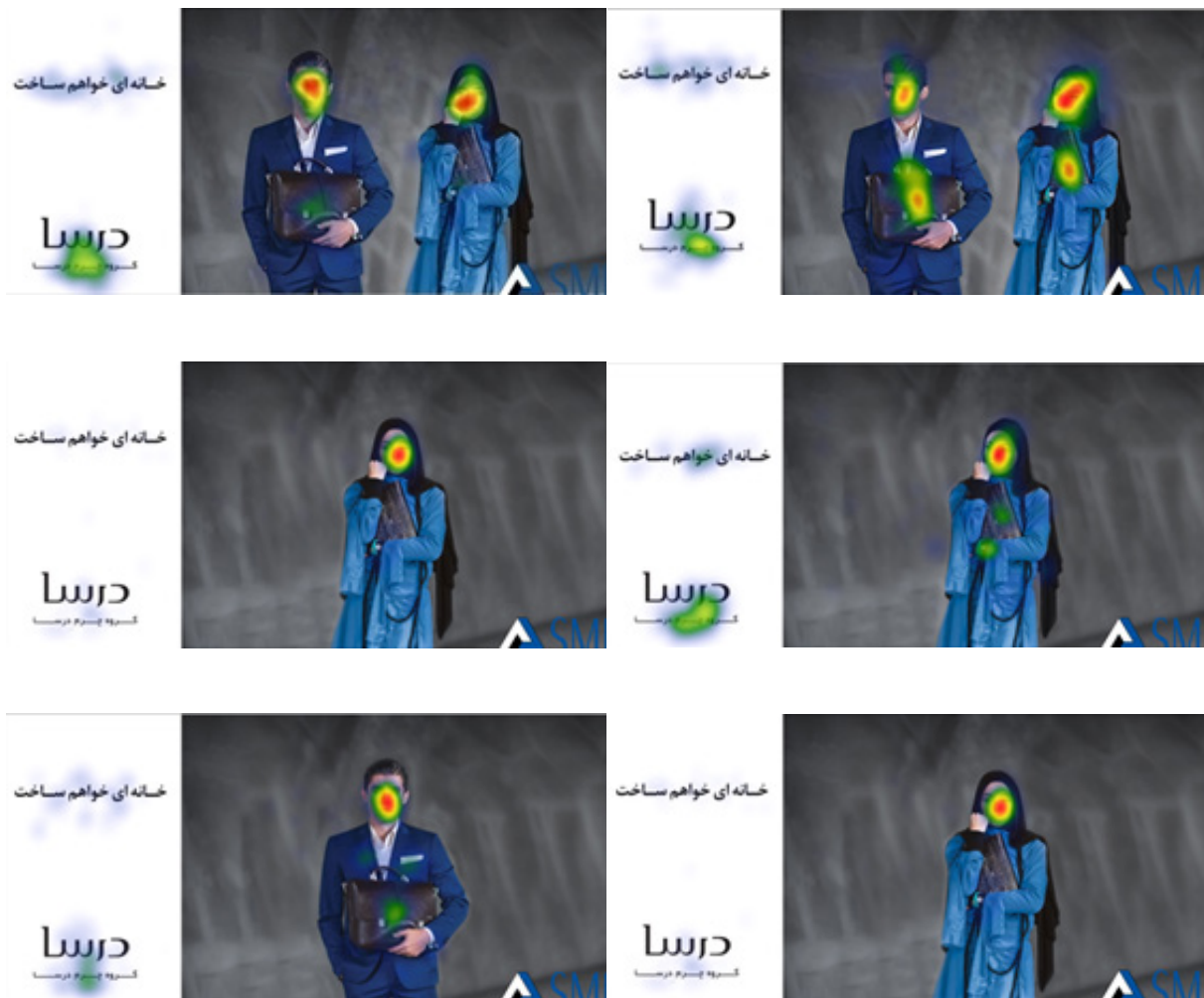
تصویر ۳- خروجی تصویری در بررسی تاثیر مسیر نگاه منبع انسانی پیام بر توجه بصری مخاطب

تثبیت در AOI محصول در مسیر نگاه متمایل بیشتر از نگاه مستقیم است ( Z=1/960, P\text{-value}=0/050 ) در خصوص بقیه معیارها تفاوت معناداری به ازای مسیر نگاه مستقیم و متمایل منبع انسانی پیام در تبلیغ مشاهده نشد. تصویر ۳ خروجی‌های تصویری در بررسی تاثیر مسیر نگاه منبع انسانی در تبلیغات را نشان می‌دهد. همانطور که در تصاویر مشخص است، نگاه متمایل منجر به جلب توجه بیشتر مخاطب به سمت هدف شده است.