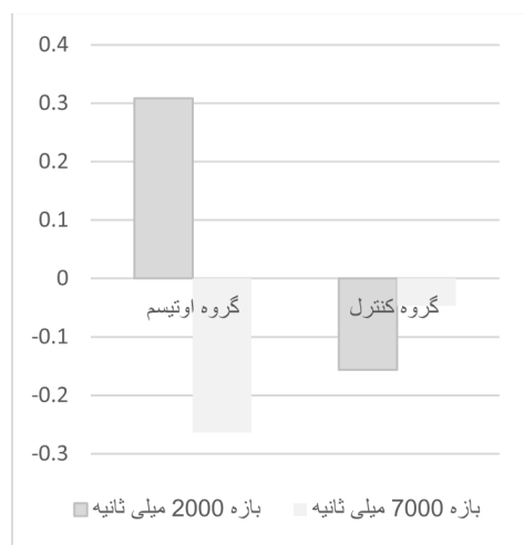
نمودار ۱ - مقایسه‌ی میانگین نمرات تصحیح شده‌ی T در تکالیف ادراک زمان (بازه‌های ۲ و ۷ هزار میلی ثانیه) در دو گروه مورد مطالعه

جدول ۲ نشان می‌دهد که تفاوت کودکان اوتیسم و بهنجار در بازتولید زمانی در بازه‌ی ۲ هزار میلی ثانیه، از نظر آماری با مقدار F = ۳۳/۲۶۸ در سطح p = ۰/۰۰۰۱ معنادار است؛ یعنی کودکان اوتیسم دچار بیش بازتولید و کودکان بهنجار دچار کم بازتولیدند. تفاوت بازتولید زمانی دو گروه در بازه‌ی ۷ هزار میلی ثانیه نیز از نظر آماری با مقدار F = ۲۳/۹۲۲ در سطح P = ۰/۰۰۰۱ معنادار است؛ یعنی هر دو گروه دچار کم بازتولیدند ولی این اختلال در گروه اوتیسم شدیدتر است (نمودار ۱).